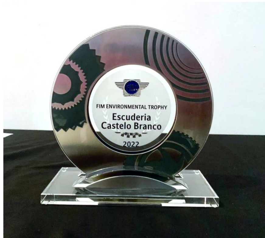
Atribuição Prémio Internacional FIM